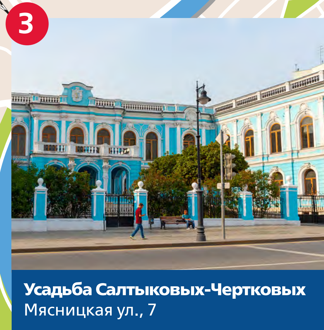
Усадьба Салтыковых-Чертковых Мясницкая ул., 7