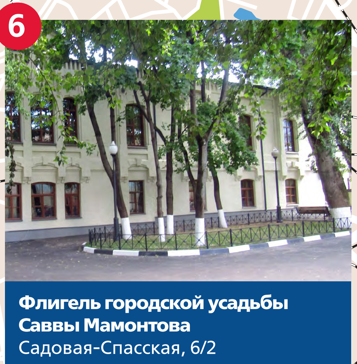
Флигель городской усадьбы Саввы Мамонтова Садовая-Спасская, 6/2