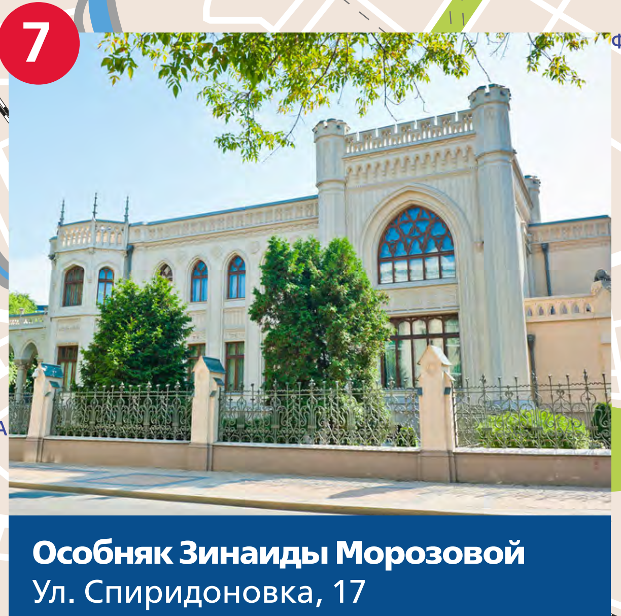
Особняк Зинаиды Морозовой Ул. Спиридоновка, 17