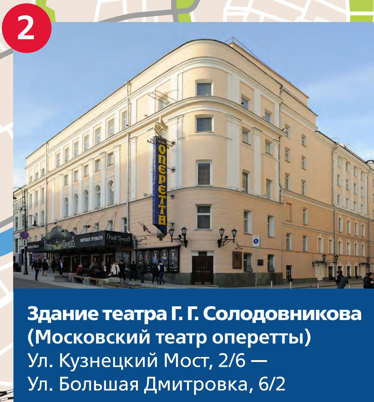
Здание театра Г. Г. Солодовникова (Московский театр оперетты) Ул. Кузнецкий Мост, 2/6 — Ул. Большая Дмитровка, 6/2