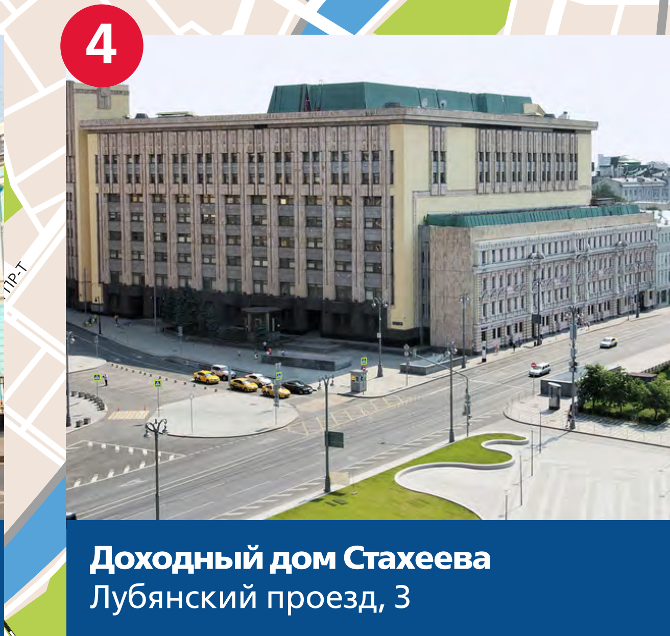
Доходный дом Стахеева Лубянский проезд, 3