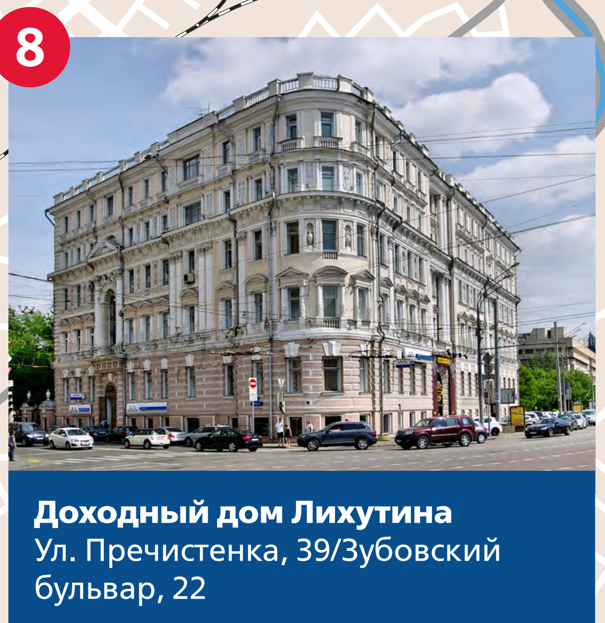
Доходный дом Лихутина Ул. Пречистенка, 39/Зубовский бульвар, 22